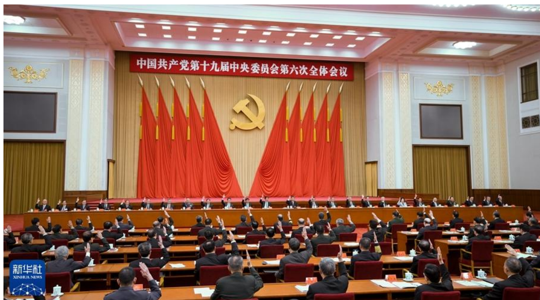
中国共产党第十九届中央委员会第六次全体会议，于2021年11月8日至11日在北京举行。中央政治局主持会议。

全会提出，党的十六大以后，以胡锦涛同志为主要代表的中国共产党人，团结带领全党全国各族人民，在全面建设小康社会进程中推进实践创新、理论创新、制度创新，深刻认识和回答了新形势下实现什么样的发展、怎样发展等重大问题，形成了科学发展观，抓住重要战略机遇期，聚精会神搞建设，一心一意谋发展，强调坚持以人为本、全面协调可持续发展，着力保障和改善民生，促进社会公平正义，推进党的执政能力建设和先进性建设，成功在新形势下坚持和发展了中国特色社会主义。