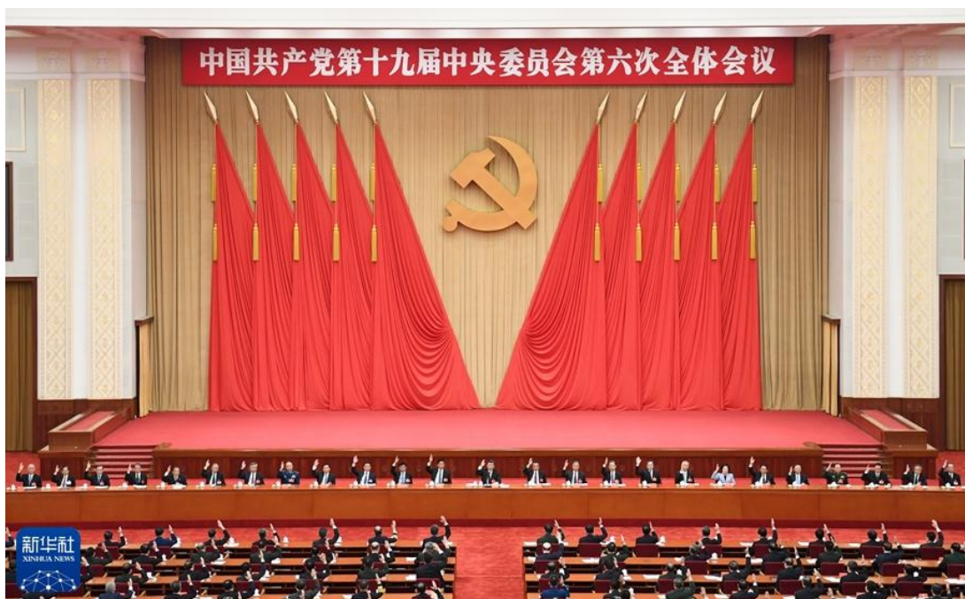
中国共产党第十九届中央委员会第六次全体会议，于2021年11月8日至11日在北京举行。

全会强调，以习近平同志为主要代表的中国共产党人，坚持把马克思主义基本原理同中国具体实际相结合、同中华优秀传统文化相结合，坚持毛泽东思想、邓小平理论、“三个代表”重要思想、科学发展观，深刻总结并充分运用党成立以来的历史经验，从新的实际出发，创立了习近平新时代中国特色社会主义思想。习近平同志对关系新时代党和国家事业发展的一系列重大理论和实践问题进行了深邃思考和科学判断，就新时代坚持和发展什么样的中国特色社会主义、怎样坚持和发展中国特色社会主义，建设什么样的社会主义现代化强国、怎样建设社会主义现代化强国，建设什么样的长期执政的马克思主义政党、怎样建设长期执政的马克思主义