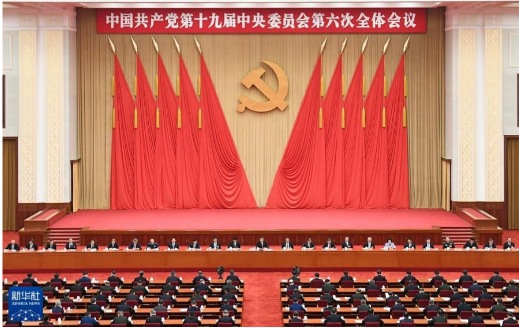
中国共产党第十九届中央委员会第六次全体会议，于2021年11月8日至11日在北京举行。

全会指出了中国共产党百年奋斗的历史意义：党的百年奋斗从根本上改变了中国人民的前途命运，中国人民彻底摆脱了被欺负、被压迫、被奴役的命运，成为国家、社会和自己命运的主人，中国人民对美好生活的向往不断变为现实；党的百年奋斗开辟了实现中华民族伟大复兴的正确道路，中国仅用几十年时间就走完发达国家几百年走过的工业化历程，创造了经济快速发展和社会长期稳定两大奇迹；党的百年奋斗展示了马克思主义的强大生命力，马克思主义的科学性和真理性在中国得到充分检验，马克思主义的人民性和实践性在中国得到充分贯彻，马克思主义的开放性和时代性在中国得到充分彰显；党的百年奋斗深刻影响了世界历史进程，党领导人民成功走出中国式现代化道路，创造了人类文明新形态，拓展了发展中国家走向现代化的途径；党的百年奋斗