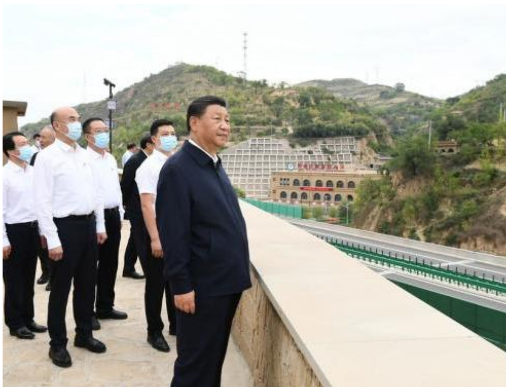
9月14日下午，习近平在绥德县张家砭镇郝家桥村考察。