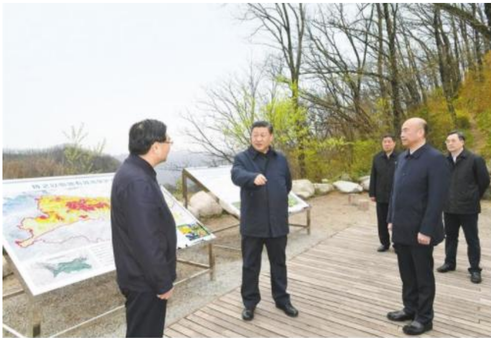
2020年4月20日，习近平在位于秦岭山脉东段的牛背梁国家级自然保护区月亮垭，察看秦岭自然生态，了解陕西省吸取秦岭北麓违建别墅问题教训、抓好生态保护等情况。